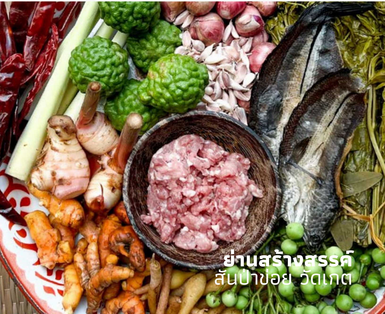
ย่านสร้างสรรค์ สันป่าข่อย วัดเกต

จุดนัดพบของคนรักอาหาร และการต่อยอดพัฒนาเศรษฐกิจสร้างสรรค์ อีกพื้นที่ที่นับได้ว่ามีความสำคัญในประวัติศาสตร์สมัยใหม่ของเชียงใหม่ ไม่ยิ่งหย่อนไปกว่าย่านสันป่าข่อยที่เราพูดถึงกันไปในบทความก่อนหน้านี้ คือ ย่านวัดเกต ด้วยทำเลที่ตั้งใกล้แม่น้ำปิง จึงทำให้ยุคที่การคมนาคมทางน้ำ