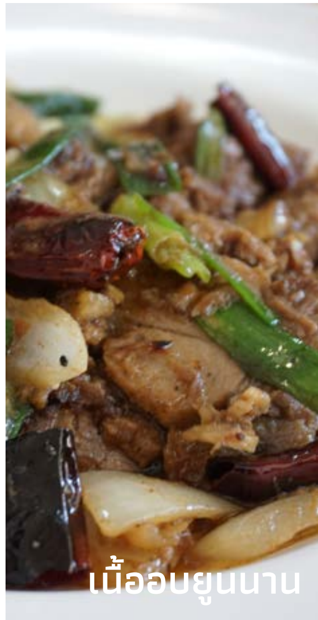
เนื้ออบยูนนาน

นี่เป็นเพียงความหลากหลายบางส่วน ของอาหารย่านวัดเกตุ ที่ทำให้เราได้เห็นถึง ความรุ่มรวยในชุมชนพหุวัฒนธรรม และสะท้อนว่า อาหารนั้นเป็นมากกว่าการกิน หากยังฉาย เรื่องราววัฒนธรรมและวิถีชีวิตท้องถิ่นด้วย