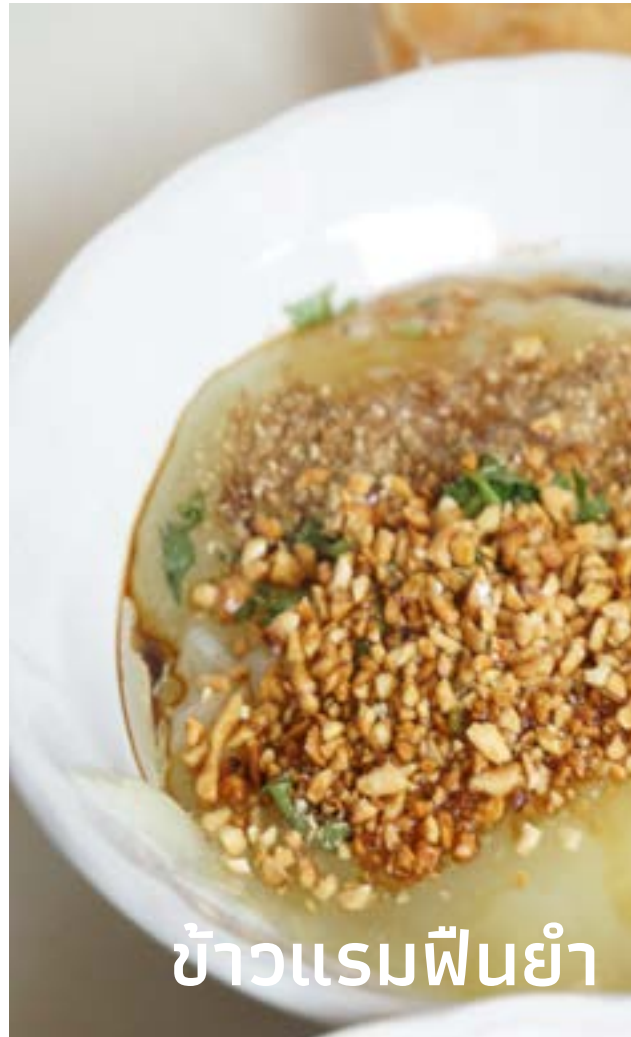
ข้าวแรมพินยา

‘ข้าวแรมพินยา’ อาหารประจำกลุ่มชาติพันธุ์ไท ทำมาจากถั่วหรือข้าวที่ไม่แล้วนำไปกวนกับ น้ำปูนใสจนสุก ก่อนตักใส่ภาชนะให้แข็งตัว ข้ามคืน จึงเรียกกันว่า ‘ข้าวแรมพิน’ หรือ ‘ข้าวแรมคืน’ ข้าวแรมพินยาคือการนำข้าวแรมพิน มาตัดเป็นชิ้นพอดีคำ ใส่ผักลวก ปรงรสด้วย เครื่องปรุง อาทิ น้ำส้ม ชিং กากถั่วเหลือง และอีกสารพัดที่ให้อร่อยสดชื่น อร่อยเข้าใจง่าย และยังจัดเป็นอาหารมังสวิรัตที่มีโปรตีนสูงอีกด้วย