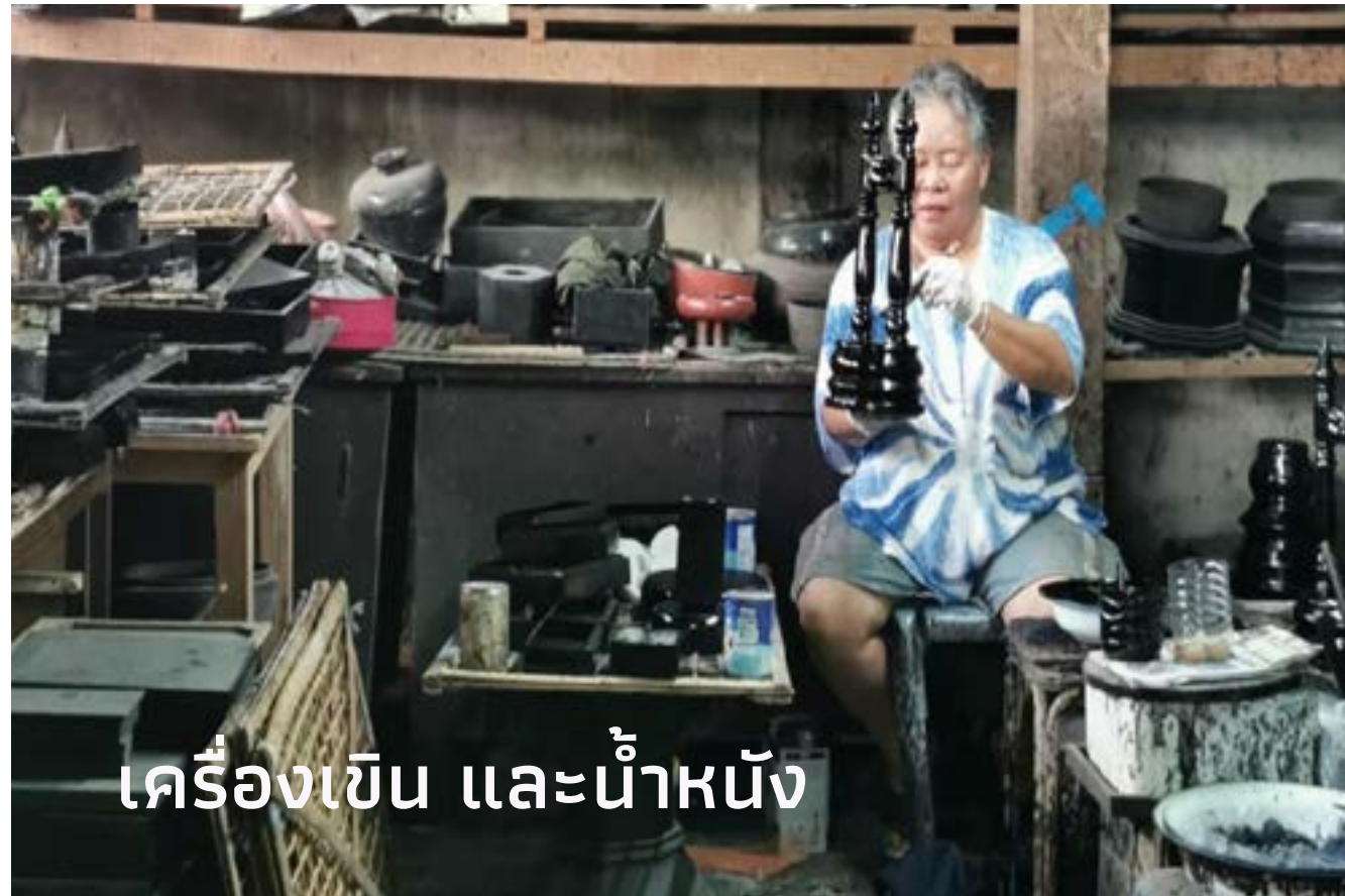
เครื่องเขิน และน้ำหนั่ง