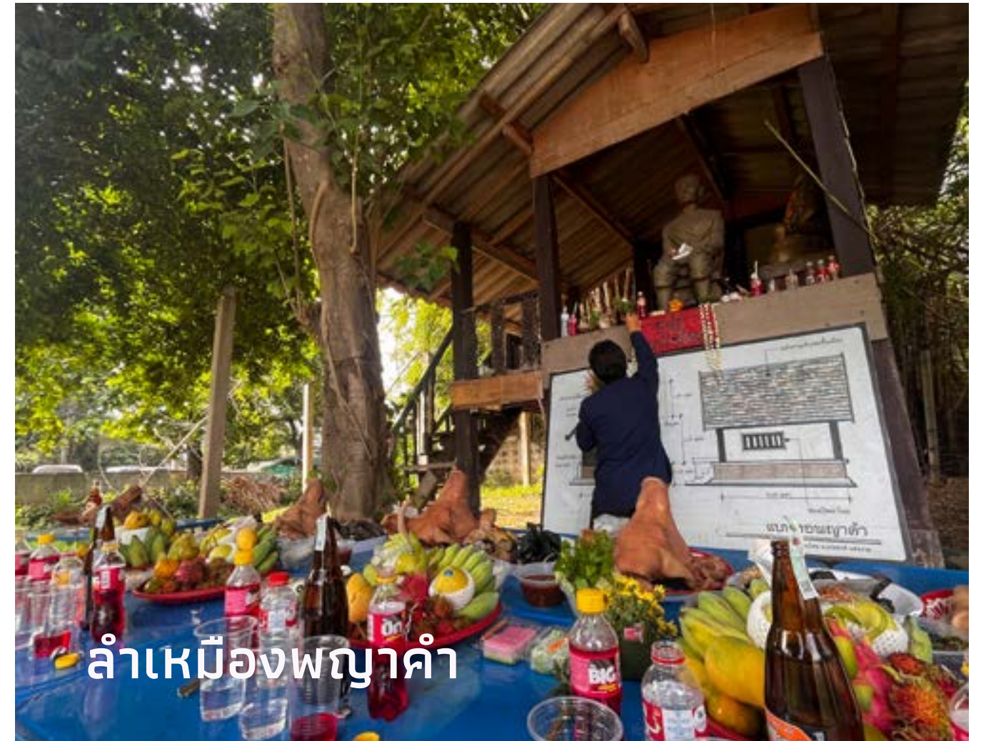
ลำเหมืองพญาคำ

ร่วมพยอมฉบับนี้ ชวนทุกท่านมาสำรวจ 3 วิถีล้านนาที่จุดประกายขึ้นจากสายน้ำ ย้อนรอยประวัติศาสตร์และคุณค่าบนกระแสดารเปลี่ยนผ่านกับการสืบสานรักษาให้อยู่คู่ชาวเชียงใหม่มาจวบจนปัจจุบัน