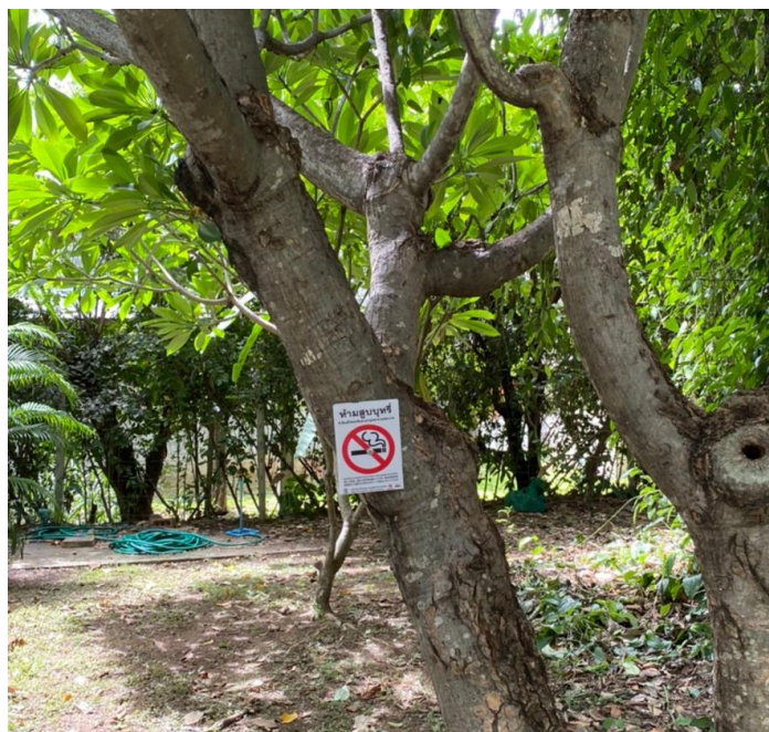
สัญลักษณ์เขตปลอดบุหรี่ภายในพิพิธภัณฑ์เรือนโบราณล้านนา